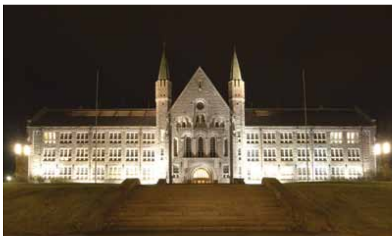
Norges teknisk-vitenskapelige universitet.

UDI (2012): Studier. ( http://www.udi.no/Sentrale-tema/Studier/ )