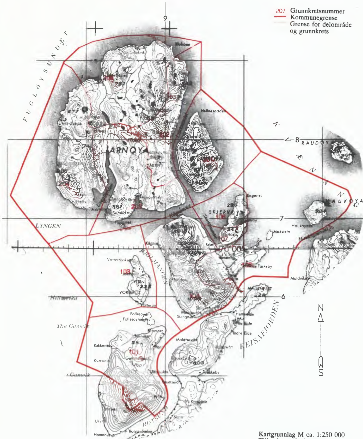
Kartgrunnlag M ca. 1:250 000 Tillatelsenr. 74/91 Statens Kartverk