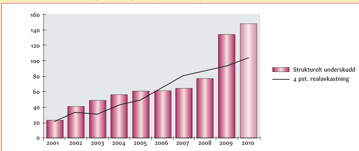
Figur 1 Forventet realavkastning av Statens pensjonsfond – Utland og budsjettunderskuddet (Mrd 2010 kr).