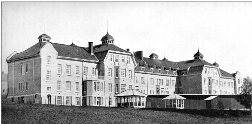
Foto: Sindssykeasylenes virksomhet 1913

Statistikken over sinnssyke inneholdt ikke bare tørre tall, men også en lang rekke historier om sykdomstilfeller, ulike behandlingsmetoder, kosthold, adspredning etc. Noen ganger var det nesten tendenser til kulørt presse-tilstander: «Paa Sanderud fandt man hos en celeber lægprædikant og religionsstifter sikre tegn paa hjernelues med emollition, (...). han hadde frembudt et tydelig billede av paranoid demens og var i sin tid blitt erklæret sindssyk efter at ha lat en av sine kvindelige tilhængere sulte og fryse ihjel.» (Sindssykeasylenes virksomhet 1914).