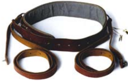
Tvangsremmer brukt ved nevrologisk avdeling på Rikshospitalet. Remmene er fra utstillingen God bedring! Mennesker, teknologi og viten på sykehus på Nasjonalt medisinsk museum.

Med opplysningstiden kom et skifte i behandlingen av avvikergrupper. Opplysningstiden betegner en ny åndsretning som ble dominerende i Europa på 1700-tallet, og som var preget av tro på den menneskelige fornuft og humanistiske idealer. Naturvitenskapens betydning økte, samtidig som kirken mistet mye av sin makt. Tidligere hadde religiøse og moralske perspektiver på galskap dominerert. Nå fulgte store omskiftninger i synet på hva som rasjonelt kunne oppfattes som